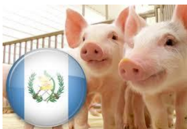
Figura 1 –Caracterización de movilización de cerdos, departamento de Sacatepéquez 2017

El compromiso de los Servicios Veterinarios del MAGA , productores organizados e industria es la obtención del reconocimiento de país libre de PPC por parte de OIE para el año 2019. Hagámoslo posible con la activa participación de todos.