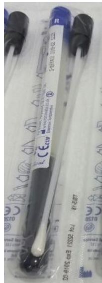
Medio de transporte