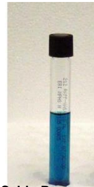
Caldo Rappaport Caldo de enriquecimiento